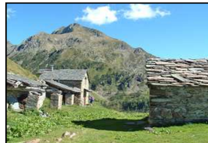
Baite del Colèt